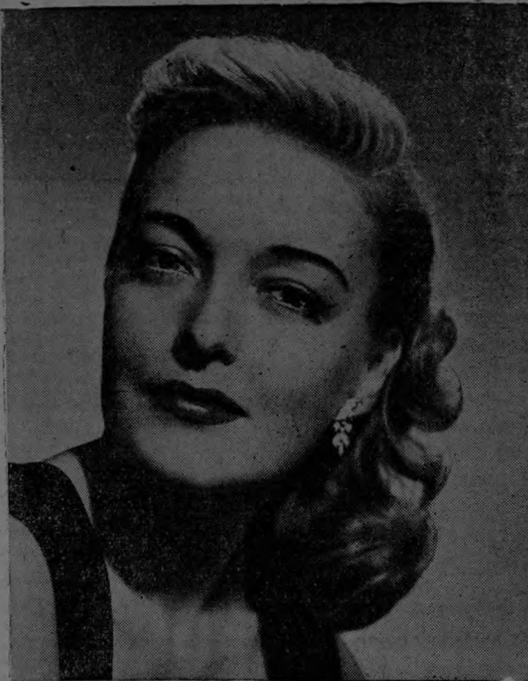
Karin Booth, estrella de la Metro Goldwyn Mayer.

Cuando los cineastas del mundo entero vean desarrollarse en la pantalla una bella historia sobre el ballet, filmada en Technicolor bajo el título de "LA DANZA INCONCLUSA", verán también el nacimiento de una nueva estrella cinematográfica.