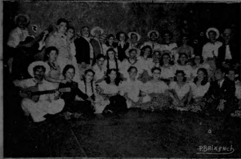
GRUPO DE ARTISTAS DE "NUESTRA TIERRA"