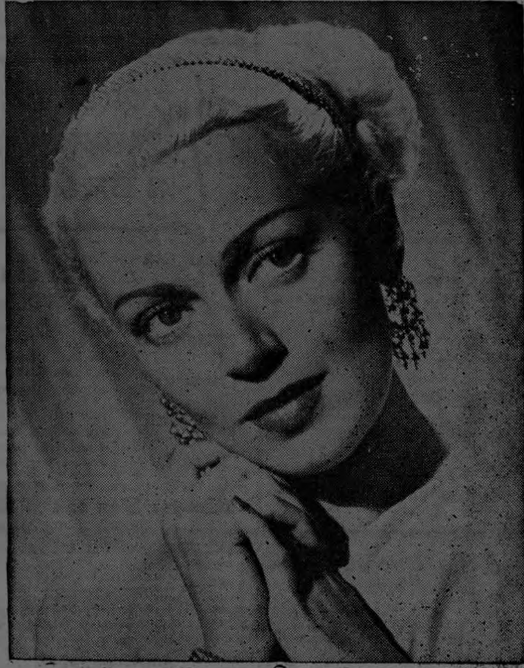
Cuando la adorable LANA TURNER, estrella de M-G-M, usa anteojos oscuros, no lo hace para que no la conozcan, di-

Y, como he hecho notar con frecuencia en estos artículos, no sólo las personas de avanzada